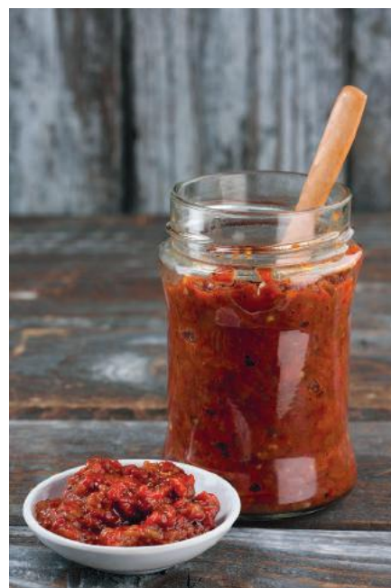
Selbstgemachter Ajvar im Glas

Die abgekühlten Paprikaschoten (und Auberginenscheiben) häuten und in sehr kleine Stückchen schneiden – wer möchte kann sie auch pürieren.